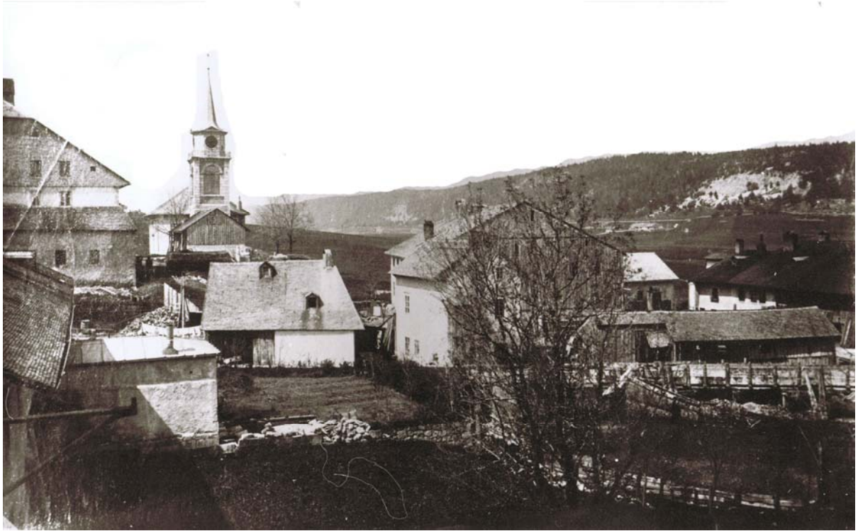
Scierie du Bas du Crêt des Forges. Est-ce avant ou après l'incendie de vers 1863, et celui-ci a-t-il réellement eu lieu ? Des questions sans réponses.