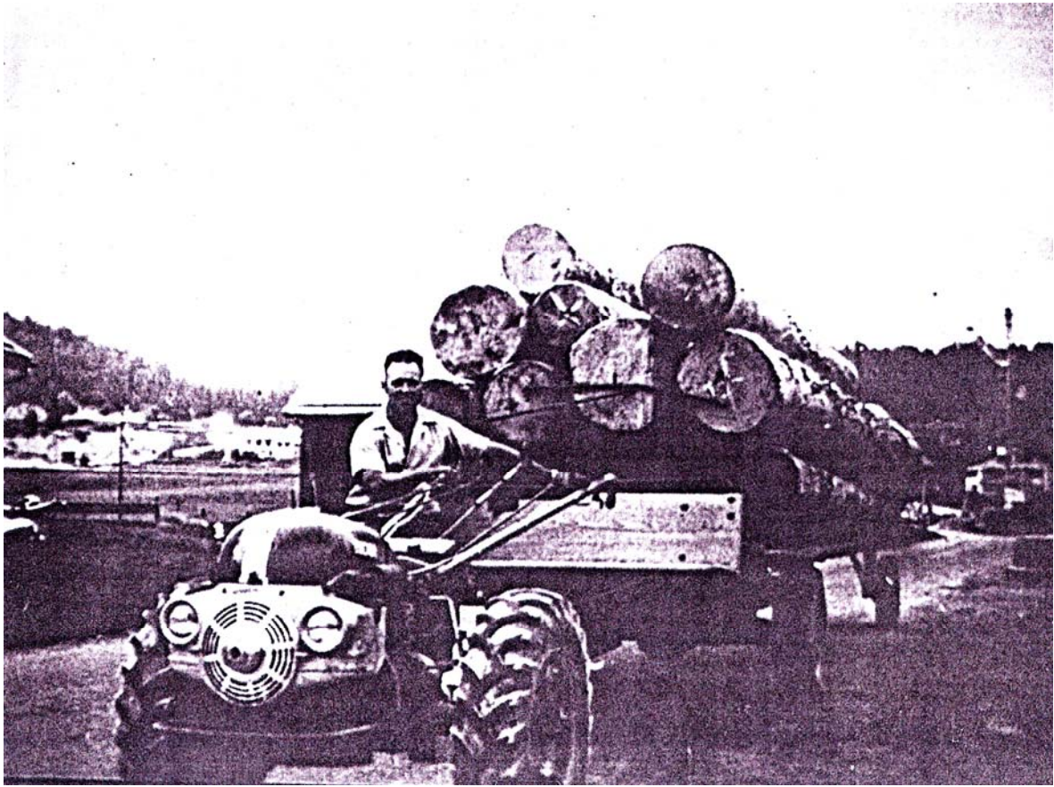
Roger Golay et son tracasset. Le courage n'a jamais manqué à ces scieurs de la Vallée dont les conditions de travail n'étaient pas toujours idéales.